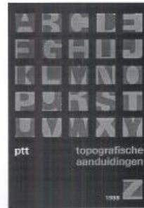
PTT-logos met plaats aanduidingen van plaatsen.

code direct: het aanbrengen van een code is vrijwillig en bij het toekennen kan met enig puzzelwerk een instelling natuurlijk zelf met een suggestie komen zolang deze aan de ISIL-ellen voldoet.